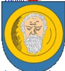
&gt;&gt; do góry